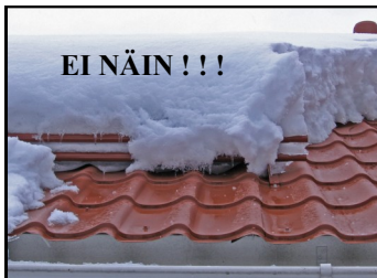
Lumikuormat on puhdistettava katoilta tarvittaessa useitakin kertoja talvessa.

Mikäli kyseiset toimenpiteet laiminlyödään, ei valmistaja ole vastuussa vaurioista tai vahingoista missään olosuhteissa.