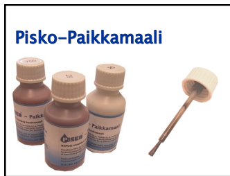
Paras vaihtoehto pieniin paikkauksiin on siveltävä Pisko-paikkamaali.