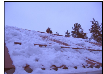
Kuormasta puhdistettu katto on turvallinen katon rakenteita ja sen ympäristöä ajatellen.