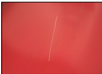
Naarmuuntunut maalipinta vaatii paikkamaalauksen.