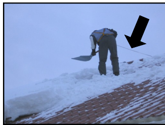
Katon puhdistamisessa on käytettävä asianmukaisia turvavarusteita ja on varmistettava, että katoilta löytyy oikeanlaiset kiinnityspisteet niille.